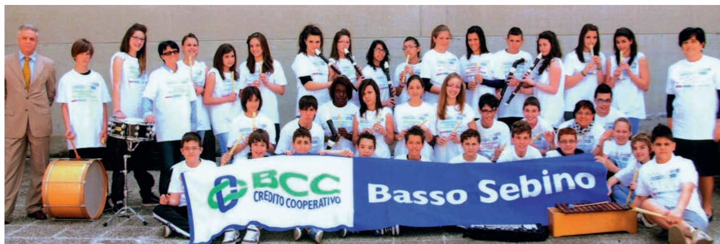
Gli studenti partecipanti al concorso musicale nazionale